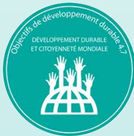
Figure 3 : logo de la cible 4.7 de l'Agenda 2030

L'éducation à la citoyenneté mondiale avec l'Éducation au développement durable (EDD) s'inscrivent au sein de la cible 4.7 de l'Agenda 2030 de développement durable. Ces deux concepts d'éducation se soutiennent et se complètent. Avec l'Agenda 2030, la Suisse s'est elle aussi engagée à prendre des mesures en matière d'éducation à la citoyenneté mondiale. Ce faisant, la Commission suisse pour l'UNESCO veut exploiter les conditions et le potentiel singulier de la Suisse.