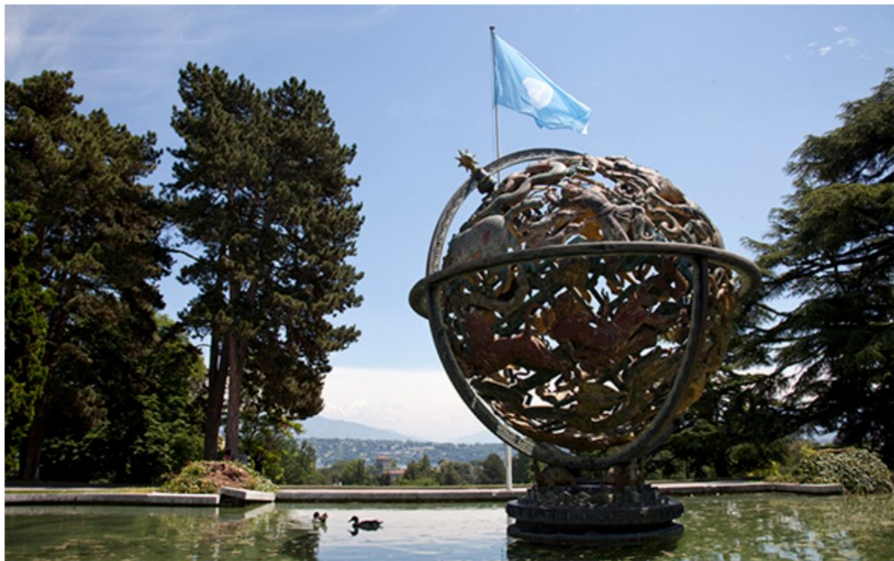
Der Himmelsglobus als Symbol des Friedens, Palais des Nations, Genf.